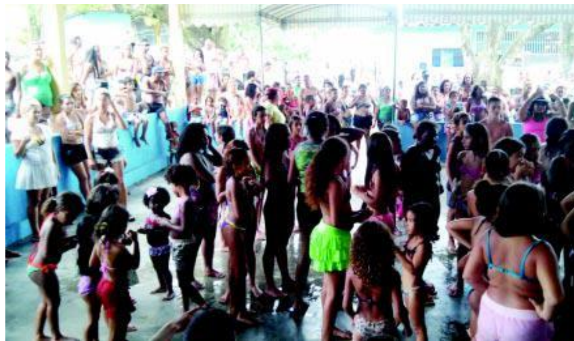
O evento em comemoração ao Dia das Crianças foi um sucesso